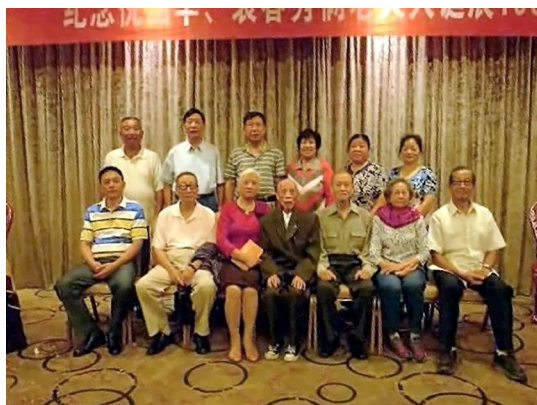
與振武、振文、衆強等表兄弟嫂合攝