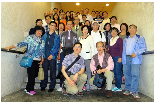
寶祥兄自澳洲返喜與平安堂友宴聚