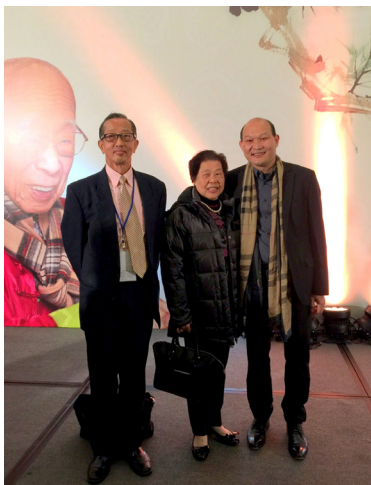
與克智兄及其慈親影於 饒公百齡宴