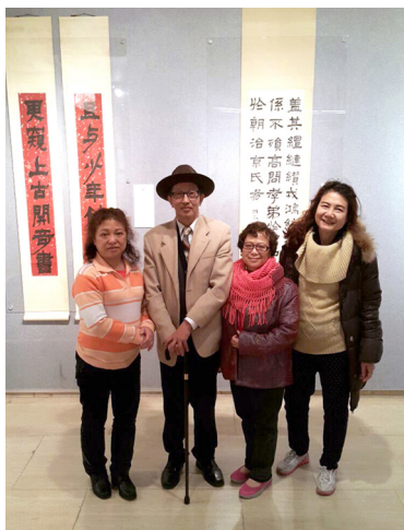
與友人攝於常宗豪教授書法展