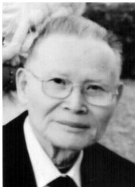
容思澤師七帙進一玉照