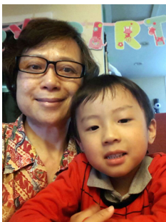
內子與長孫耀光合影