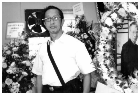
攝於伯桐師靈堂前