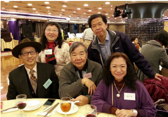
與青年會舊同事合影