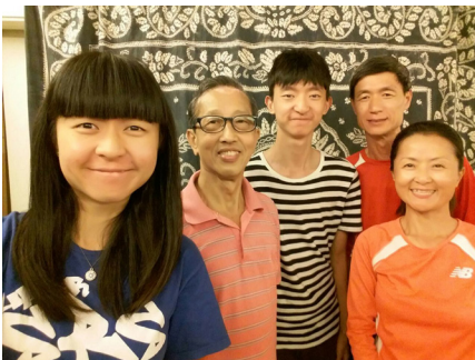
與浩瀚兄全家合影