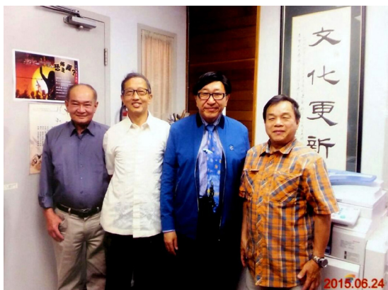
與梁博士（右二）、煒光兄、二哥 合攝於梁博士文化更心中心