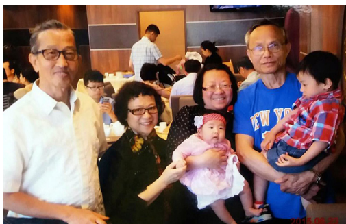
與海保姻親賢伉儷及孫兒合照