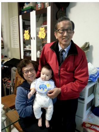
與內子及樂仁孫合影