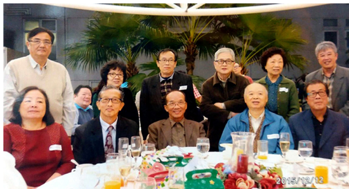
與青年會舊同事合影