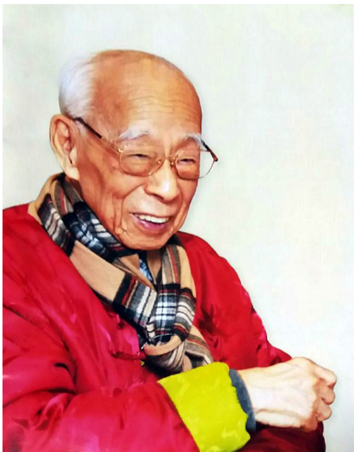
饒宗頤教授百歲華誕玉照